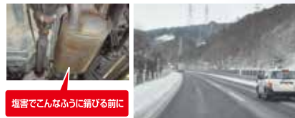
塩害でこんなふうに錆びる前に

被膜が厚く高耐久。一般的な防錆塗料と比較すると、抜群の効果を発揮します。錆の上からでも施工でき、進行を抑えることができます。 耐久: 約3年 ¥30,000(税込)~